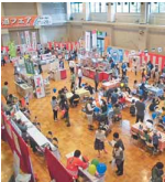
ガス水道フェアなどを通して新ガス料金を機動的にPRしている