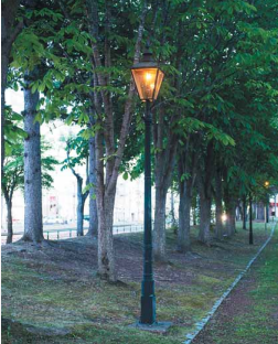
帯広中央公園(北海道帯広市)

ガス灯のある街 緑豊かな帯広中央公園は、帯広小学校跡地に1978年に造成された公園です。帯広市は1988年に開校し、1995年にこの地へ移転して以降、1972年に建設へ移るまでここを学舎として使った。半世紀にわたって緑の公園に生まれ変わったことは感嘆すべきでしょう。市民が憩うこの場所をガス灯が照らします。