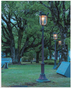
宮崎県総合文化公園(宮崎県宮崎市) ガス燈のある街 公園が立ち並ぶ緑豊かな宮崎県総合文化公園は、図書館・美術館・芸術劇場の3つの文化施設と2つの広場が一体的に整備された、調度文化の拠点です。ユニークな取り組みの1つが、ウェブサイトのアクセス数から万人を数えるごとに、公園内に新たな花を散らすというもので、開花することが花活動につながります。