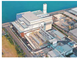
12月に完成予定の新南浦清浄工場