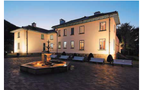
ライトアップした旧イギリス領事館