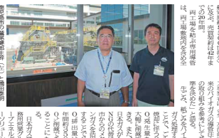
宮崎県宮崎市にある「宮崎県総合文化公園」の売店。ここでは、公園のグッズや、地元産品の販売が行われている。...