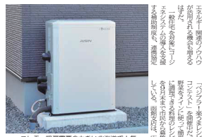
コロシモ。燃料需要の大きい北海道で人気