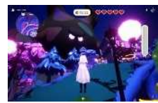
謎のおぼけが出現

なお、ガスパビリオンに関する過去の発表内容は公式 Web サイト等をご覧ください。