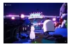
突然、怪しい雰囲気