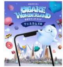
ウェルカム XR イメージ

ガスパビリオンのご入場前から、拡張現実 (AR) のおぼけの世界をお楽しみいただけるコンテンツです。ガスパビリオンの前でお手持ちのスマートフォンを空中にかざすと、「ミッチー」とその仲間たちが現れます。最新の AR 技術をぜひ、ご体験ください。