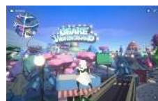
おぼけを探す冒険に