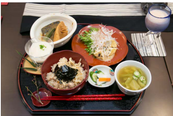
吉永さん親子作 「北九州の伝統と地元食材で彩るヘルシーぬか炊き御膳」