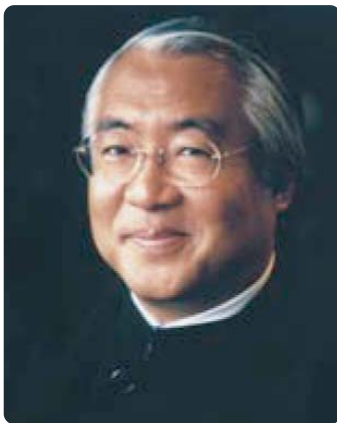
服部幸應氏 (服部栄養専門学校校長)

抽選で 150名さまをご招待 ご来場の皆さまにプレゼントを ご用意しております。