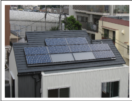
戸建住宅用の集熱パネル

戸建住宅の屋根やマンションのバルコニーのてすりに設置した「集熱パネル」と「貯湯タンク」で構成される「強制循環式太陽熱利用システム」と、「ガス給湯器」を組み合わせた太陽熱利用のガス温水システム。ガス給湯器で太陽熱からできる温水を瞬時にバックアップすることが可能で、いつでもお湯を使用することができる。