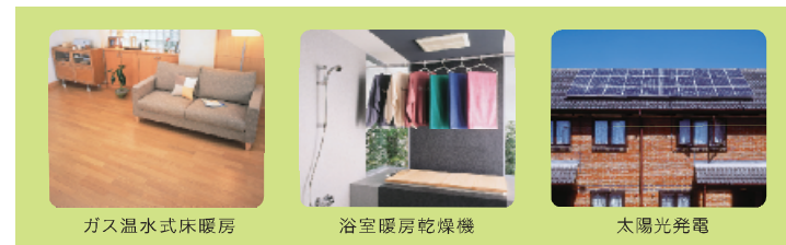
ガス温水式床暖房